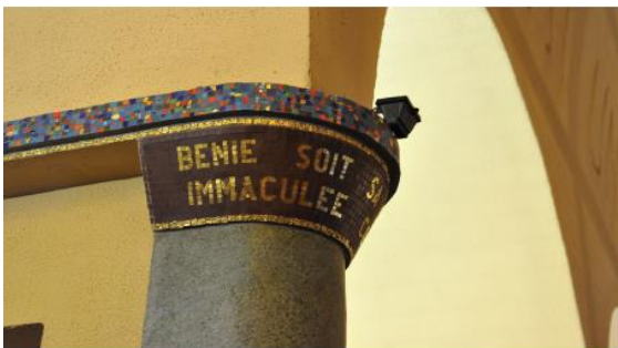
Chapiteau d'une colonne engagée de la nef

Le décor intérieur est sobre mais soigné. L'espace est simple, rythmé par des colonnes engagées plus sombres et traitées avec un enduit décoratif, un ornement de mosaïque sombre, d'où ressortent, en lettres dorées, les louanges mariales à l'Immaculée Conception. Une frise de faïence colorée coiffe le chapiteau et parcourt les bas-côtés.