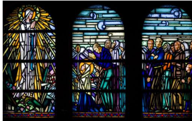
Vitrail Art Déco du chœur, Apparition de la Vierge à Bernadette, du maître-verrier Ruault de Rennes

La sévère architecture des murs en béton armé remplis de mâchefer issu des fours de faïencerie est contrebalancée, à l'intérieur, par des vitraux aux couleurs éclatantes (restaurés en 2019), de part et d'autre de la peinture murale qui épouse la courbe de l'abside.