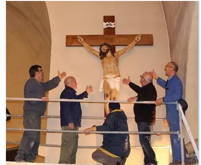
Les photos des Sapeurs Pompiers posant la Croix ont été réalisées par Laurent Marrhic

L'autel, l'ambon et les fonts baptismaux combinent le marbre, le béton et les revêtements de pierre. La céramique Art déco est présente au sol.