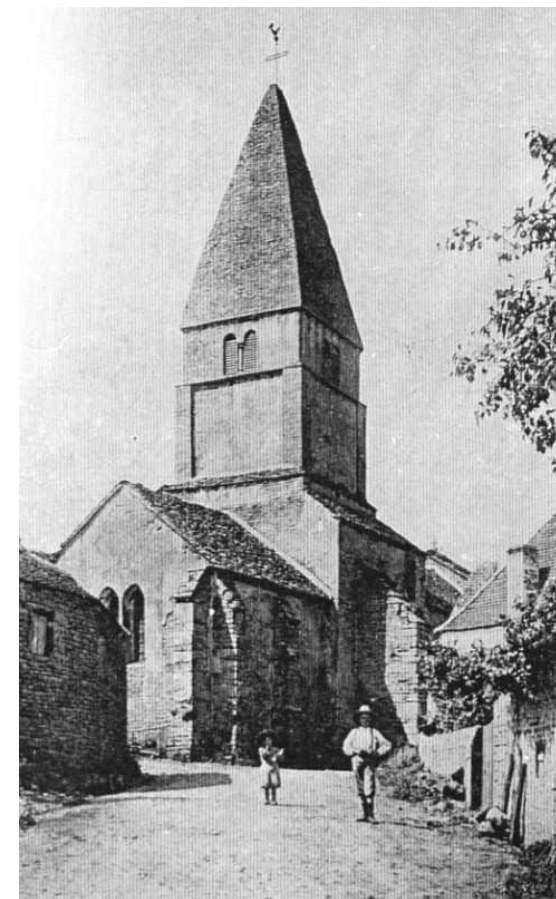
Eglise de Saint Martin du Tartre