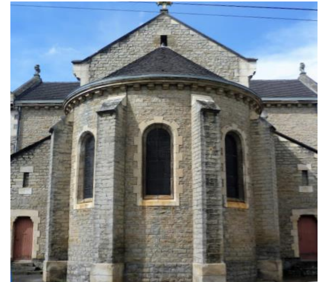
Chevet de l'église du Sacré-Cœur de Bellevue

Cette église est couverte de toits à longs pans en tuile mécanique, (avec croupe ronde en tuile écaille pour le chœur), à l'exception des collatéraux couverts en appentis. Les murs sont en moellon de calcaire.