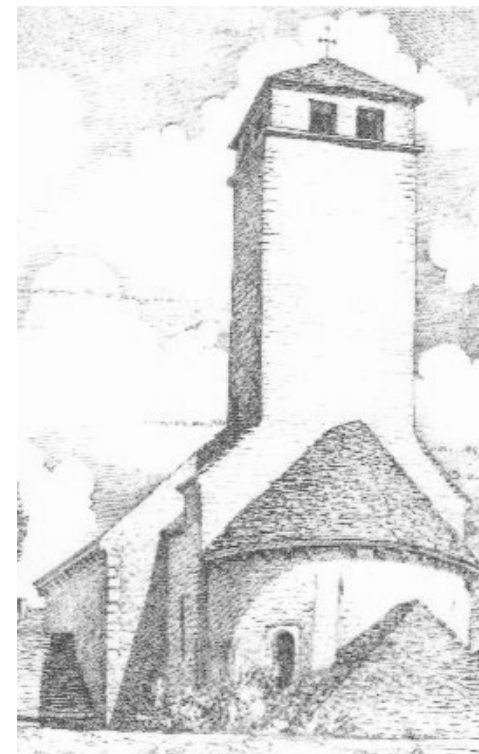
Dessin de Michel Bouillot, Carte postale Association de sauvegarde et de mise en valeur de Saint-Clément-sur-Guye