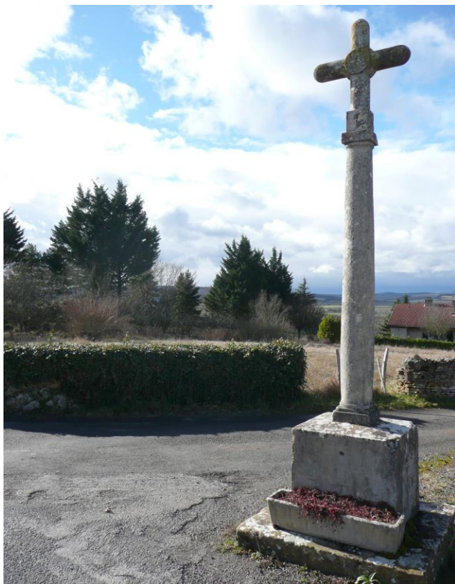
1. Croix Blanche (XIXe siècle), à Ameugny, rue de la Croix-Blanche, croix de carrefour située à l'intersection de la route de Cormatin à Cluny D981 (en empruntant la D14) et de la rue de la Croix Blanche D414.

Sur un socle quadrangulaire se dresse une croix de pierre cylindrique sur un fût de même section avec un simple cercle en relief au croisillon.