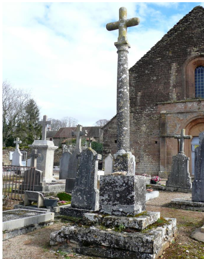
2. Croix du cimetière (1852) du bourg d'Ameugny, située dans le bas du cimetière, en face de l'entrée de l'église.

Sur un socle quadrangulaire se dresse une croix de pierre cylindrique sur un fût de même section avec un simple cercle en relief au croisillon.