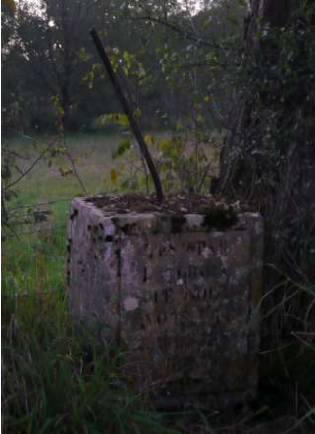
6. Croix du Quart , à côté de la petite route qui monte presque en face des lagunes, sur la commune de l'Hôpital-le-Mercier . Il ne reste que le piédestal avec l'inscription « C'est par la croix que nous avons été rachetés » et la date de 1886.

Avec les photos et l'aimable collaboration de Marie-Anne Gerbe.