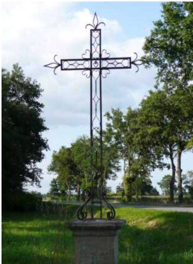
1. Croix routière du Pantin, en fer forgé, sur la D982 de Paray-le-Monial à Marcigny, à côté de la petite route qui rejoint les Crots-Barbe. Elle porte, sur le piédestal, la date de 1901 et la même inscription que celle de la croix devant l'église: « O Crux ave ». Motif : cœur surmonté d'une petite croix à l'intersection des bras de la croix.