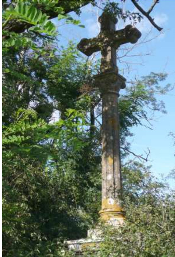
7. Croix des Bordes , à 2 km de l'Hôpital-le-Mercier, à l'intersection d'une route et d'un chemin, près d'un hangar agricole. Le fût cannelé à chapiteau porte une croix bourgeonnée. Le motif du croisillon est le Sacré-Cœur , dont la dévotion connut un large développement à partir du XVIIe siècle, depuis les visions de Marguerite-Marie à Paray-le-Monial. Le culte du Sacré-Cœur entre dans l'Église universelle en 1856. Une prière est gravée sur le piédestal : « Appliquez-nous le mérite de votre Passion et Sauvez-nous par votre Croix. »