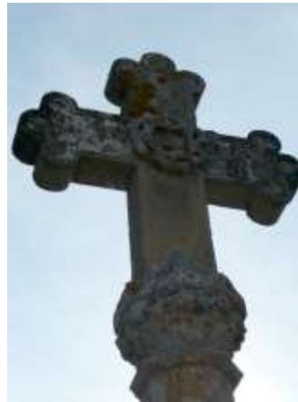
Détail de la Croix 4, avec le motif de la couronne d'épines au croisillon.

reprendront au XIXe siècle après la tourmente révolutionnaire et avec le Concordat. Ces missions, prêchées par des prêtres extérieurs à la paroisse, duraient entre une et trois semaines. On assistait à des messes, des processions, des prêches, des confessions. Puis, pour fêter dignement la clôture de la Mission, on érigeait une croix en présence des fidèles et des autorités ecclésiastiques. Une date inscrite sur la croix précisait la période de la mission. Beaucoup de croix de mission datent du début du XIXe, après la mise en vigueur du Concordat de 1801 entre Bonaparte et Pie VII rétablissant la liberté des cultes. Ces croix ont souvent remplacé des croix plus anciennes, situées au même emplacement, et disparues à la Révolution. L'ordre missionnaire le plus actif dans ces missions paroissiales en Saône-et-Loire a été celui des Oblats de Marie Immaculée (O.M.I.) qui résida, à partir de 1858, à la Maison d'Autun.