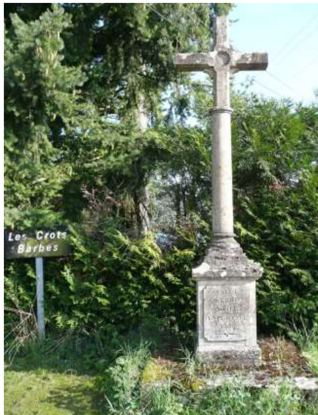
2. Croix de Crots Barbe, biseautée sur fût cylindrique, et tablette débordante, avec inscription sur le piédestal : « Salut, ô Croix Notre Espérance », traduction de l'hymne latine en l'honneur de la sainte Croix, « O Crux ave, spes unica », début du 1er vers de la 6e strophe de l'hymne latine en l'honneur de la sainte Croix, « Vexilla Regis », attribuée à Venance Fortunat, évêque de Poitiers au VIe siècle : « O Crux ave, spes unica, / Hoc Passionis tempore / Auge piis justitiam / Reisque dona veniam. » « Salut, ô Croix, unique Espérance / Dans ces temps de la Passion / Fais croître la justice pour les justes / Et donne le pardon aux pêcheurs. »