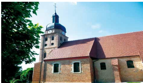
Eglise Saint Eusèbe à Saint Usuge , Paroisse Saint Pierre en Louhannais

Il revient d'exil à la mort de Constance et de sa vaine entreprise arienne. Eusèbe retrouve alors ses fidèles piémontais qui l'aiment. Il finit paisiblement sa vie au milieu d'eux, le 1er août 370. Saint Eusèbe est le patron de l'église de Saint-Usuge, dans la Paroisse Saint Pierre en Louhannais. Il y est représenté dans un vitrail de la nef. Le village lui doit son nom. On le fête le 2 août.